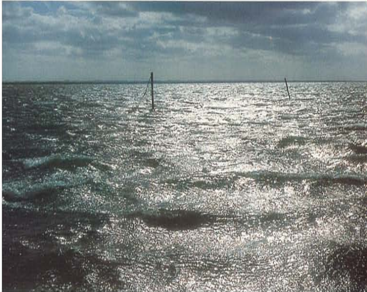
Dreigende storm boven Strynø.

Zeekajaks, complete zee-uitrusting; 1- of 2-persoons. Kampeeruitrusting, kaart, kompas of GPS, radio voor weerbericht (Duits Seewetterbericht dagelijks op MW 1269 m). Zie ook www.oppad.nl , Uitrusting/paklijsten (alleen voor abonnees).