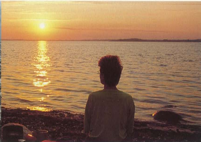
Zonsondergang aan het strand van Avernakø.

lage steun en doorvaren. Na enkele minuten zijn we er doorheen en wat later peddelen we uit de wind langs de beboste oevers van Tåsinge. Het is pas acht uur 's ochtends als we stoppen voor een welverdiende pauze. Ik krijg met wat benzine het natte drijfhout aan en maak een vuur om ons te drogen en te warmen.