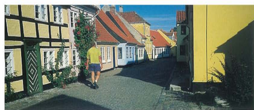
Kleurige vakwerkhuisen en keienstraatjes in Æroskøbing.

kwaadaardig zwart, met schuimkoppen overall. We zitten vast! Dan de tent maar weer opgezet. We kijken naar de aanzwellende storm en zoeken de kro van het eiland op. Die is ingericht in een oude smederij; alle gereedschappen hangen er nog. Aan de muren een paar deprimerende schilderijen van dronkaards en neerslachtige types. Ook dat hoort bij het eilandgevoel: slecht weer, isolement, depressie en drank. De heerlijke gestoofde rodspøte , schol, smaakt er niet minder om. 's Avonds luisteren we naar het Duitse Seewetterbericht , dat minutenlang in slow motion voortkabbelt (zodat je kunt meeschrijven, als je niet in slaap valt tenminste): B-e-l-t-e u-n-d S-u-n-d s-ü-d-w-e-s-t