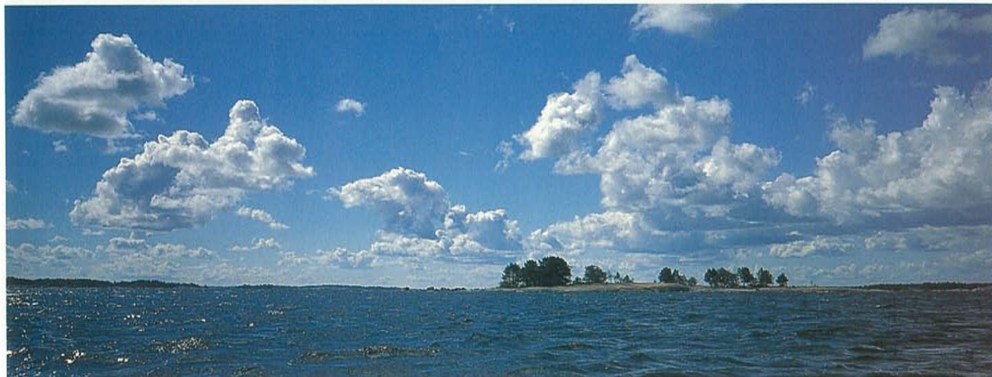
Soms moeten we een stukje over open zee.

De Åland Eilanden: maar liefst 6700 eilandjes en onbewoonde scheren tussen Zweden en Finland. Twee weken varen we door dit droomgebied voor zeekajakers: we stoppen waar we willen, genieten van de warme Finse zomer en zijn één met de natuur.